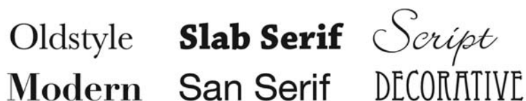
Figure 8 : Six catégories de police

Les polices sont souvent classées par catégories selon qu'elles contiennent ou ne contiennent pas de sérifs, ces petits traits en haut et en bas des lignes principales qui forment chaque lettre. Il existe des milliers de polices (bien trop pour qu'on puisse toutes les mentionner dans ce didacticiel), la plupart d'entre elles appartiennent à l'une des six catégories (Figure 8).