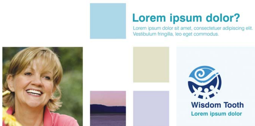
Figure 6 : Cette grille modulaire offre des possibilités presque illimitées et son alignement garde la page nette et organisée.