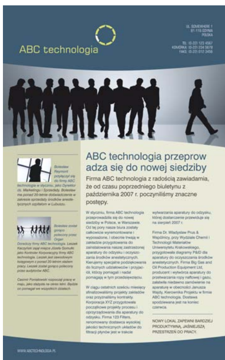
Figure 7 : L'œil du lecteur est attiré sur l'histoire de droite par le gros titre et le texte. Le contenu de la partie gauche est moins important, si bien que le texte est plus petit et sur un arrière-plan de couleur différente.

La façon dont vous disposez (organisez) votre contenu est un composant central du dessin. Vous pouvez attirer l'attention du lecteur sur la partie la plus importante de votre travail en utilisant la taille, le poids, le placement et l'espacement. Cet aspect de la disposition est appelé hiérarchie du dessin. Des exemples de disposition hiérarchique peuvent se trouver dans les journaux, les magazines et les affiches (Figure 7).