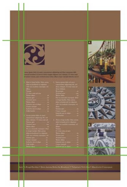
Figure 2 : L'alignement des éléments sur la page suggère que le contenu a été pensé et organisé, et que, par conséquent, il vaut la peine d'être lu.

En règle générale, un élément essentiel sur votre page constitue un point focal avec tous les autres éléments alignés. Lorsque vous ajoutez un nouvel élément à votre disposition, alignez les deux éléments sur une ligne invisible.