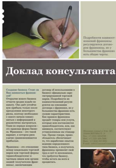
Figure 4 : La bannière contraste avec le corps du texte et la grande photo contraste avec la petite photo. Les éléments sont reliés mais ils sont différents, et les différences ajoutent un intérêt visuel.