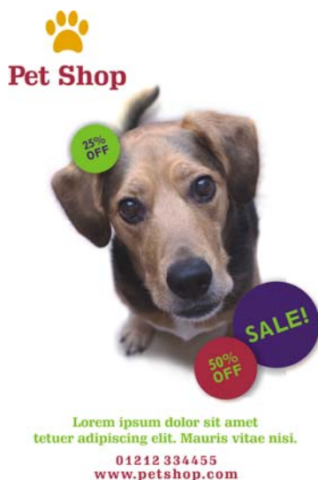
Figure 3 : La répétition de thèmes visuels, tels que les cercles, la couleur et la police, permet d'unifier le dessin tout en laissant de la place à la créativité.

Un mot d'avertissement concernant le principe de répétition : veillez à ne pas exagérer. La répétition excessive d'un élément peut encombrer la page et rendre le message difficile à comprendre. Dans le doute, restez simple.