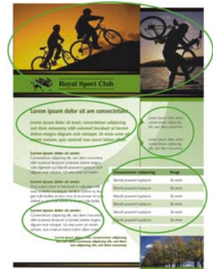
Figure 1 : Notez la façon dont chaque groupement de texte et de photos est organisé sur la page. La proximité des éléments liés permet aux lecteurs de parcourir le contenu de la page.

Le principe de proximité signifie que les éléments liés doivent être groupés pour former une unité cohérente. En utilisant ce principe, vous pouvez réduire l'impression de désordre et améliorer la clarté. Votre contenu et vos messages sont rationalisés et les utilisateurs sont plus susceptibles de les lire et les mémoriser (Figure 1).