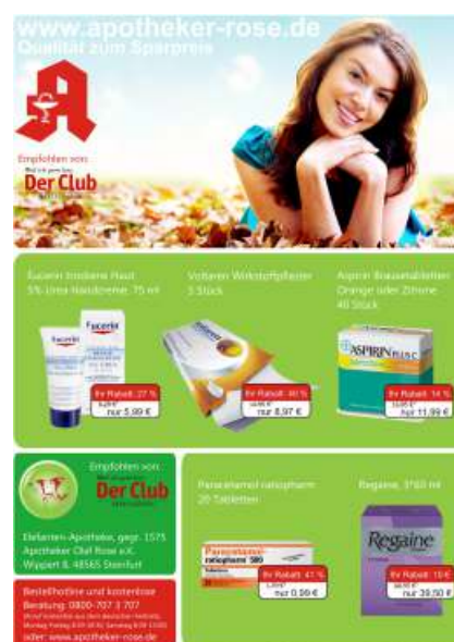
De voorkant van de catalogus van de postorderapotheek voor 2009

uiteenlopende activiteiten leunen we zwaar op CorelDRAW®," licht Olaf Rose toe. "Elk kwartaal produceren we meer dan 20.000 folders met aanbiedingen voor Pharmaxi. Daarnaast maken we catalogi voor de Bertelsmann Club met meer dan 16 pagina's aan product- en prijsinformatie." Hiervoor maskeert hij productafbeeldingen van farmaceutische ondernemingen op een nieuwe,