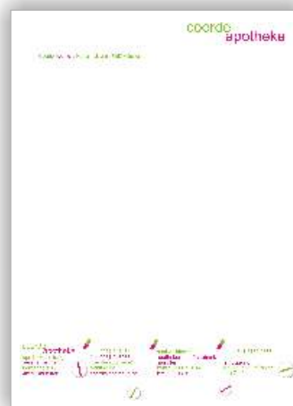
Briefpapier met het nieuwe bedrijfsimago van de Coerde-apotheek in Münster

hij ruiterlijk toegeeft geen idee te hebben van zaken als overtrekken en verklaart dat hij zeker geen professional is, zegt hij dat CorelDRAW® alles gewoon veel eenvoudiger maakt. "Ik werk wanneer ik kan, en dan kan ik een brochure in 16 pagina's in een à twee weken rond krijgen. Een Pharmaxi-folder kost me een dag of twee." Hij heeft geheel zelf de verpakking ontworpen voor een medicijn voor psychische aandoeningen dat hij in zijn laboratorium samenstelt.