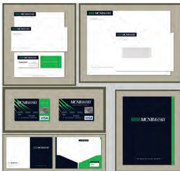
Identity America 向 MCNB 银行提供的各种专业设计包括信头、宣传册、名片、信封、借记卡和信用卡等。