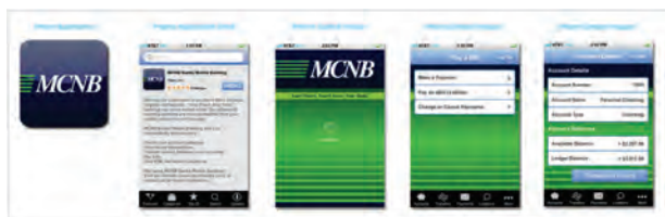
Die neuen iPhone- und Mobile-Banking-Apps von MCNB Banks wurden von Identity America entworfen.

„Letztendlich verhelfen wir unseren Kunden durch die Verwendung von CorelDRAW zu einem starken Auftritt“, erklärt Neal. „Wir wollen, dass unsere Kunden stolz sind auf ihr Image und ihre Identifikation.“