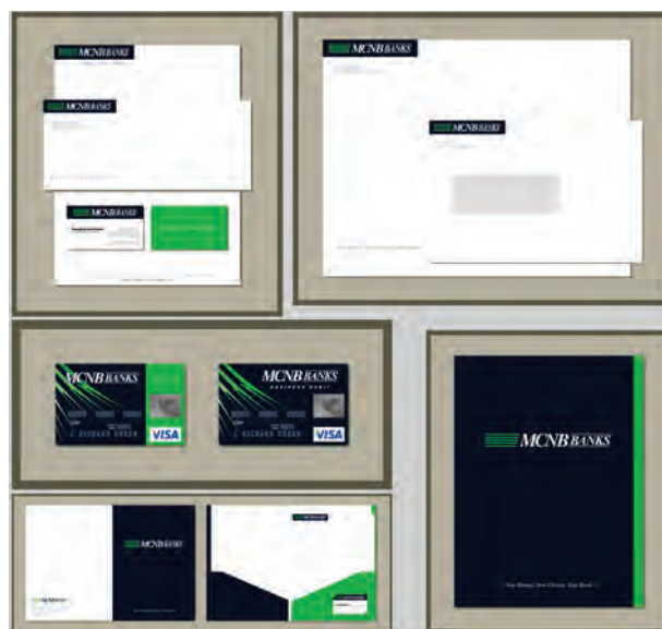
Eine Reihe von Designs, die Identity America für MCNB Banks gestaltet hat: Briefköpfe, Broschüren, Visitenkarten, Briefumschläge, Bank- und Kreditkarten und vieles mehr.