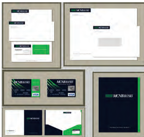
La colección de diseños profesionales proporcionados a MCNB Banks por Identity America incluye membretes, letreros, tarjetas de visita, sobres, tarjetas bancarias y de crédito, y mucho más.