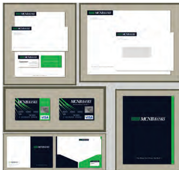
De professionele ontwerpen van Identity America voor MCNB Banks bestaan onder andere uit briefpapier, brochures, visitekaartjes, enveloppen, bankpassen, creditcards en veel meer.