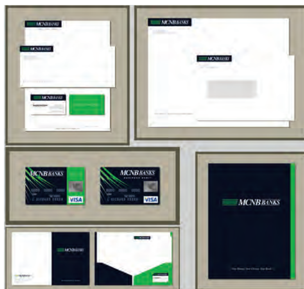
Элементы фирменного стиля, разработанного для MCNB Banks: фирменный бланк, брошюры, визитки, конверты, банковские и кредитные карты и многое другое.